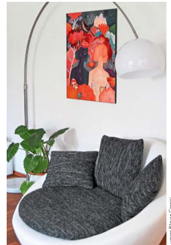
Lucrare Răzvan Cornici

Deși arta dă viața casei, regula „ce e prea mult strică” se aplică și aici. Lasă spațiu între lucrările de artă, dă-le șansa să se exprime, fără să le aglomerezi sau să le scoți din context. Dacă operele nu au legătură unele cu altele și nu compun împreună o poveste, este mai bine să le expui separat. De exemplu, 20 de tablouri expuse pe un perete nu înseamnă doar că tot conceptul este pierdut, dar arta devine mai degrabă un kitsch decât un statement. Artă ar trebui să fie doar un accent al camerei.