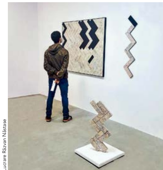
Lucrare Răzvan Năstase

Folosește arta pentru a te juca cu dimensiunile. De exemplu, două scaune stinghere de o parte și de alta a unei piese de mobilier masiv pot fi puse în valoare de două tablouri plasate deasupra fiecăruia. Artă contemporană sau tonurile de alb-negru completează foarte bine piese de mobilier vintage.