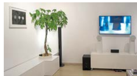
Lucrare Ciprian Ciuclea

Televizoarele, aparatul de aer condiționat și alte electrocasnice sunt lucruri necesare în fiecare casă, dar pot „strica” designul. Artă ajută să le „ascunzi” într-un mod creativ. Fie că alegi să expui o sculptură deasupra ecranului televizorului sau un tablou chiar pe aparatul de aer condiționat, posibilitățile sunt nelimitate.