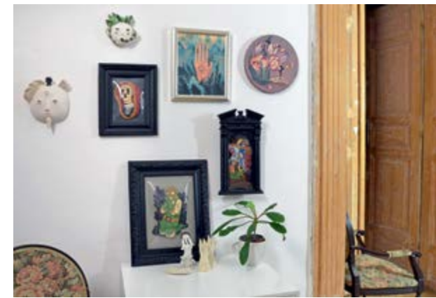
Lucrare Răzvan Cornici

O lucrare unică, creată de un artist va aduce mai multă valoare locuinței decât un poster de serie care poate fi replicat în sute, chiar mii de exemplare. Unicitatea! Cea mai importantă caracteristică a unei lucrări de artă.