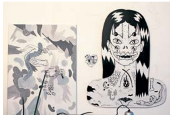
Lucrare Mimi Cioba

Dimensiunea lucrărilor în raport cu spațiul este un factor vital în decorul unei case. Indiferent unde decizi să expui lucrarea, este necesar ca aceasta să se integreze în ansamblul camerei, astfel încât să nu fie umbră de alte piese sau să nu distragă atenția de la altele. De exemplu, atunci când vrei să plasezi lucrări de artă deasupra unei canapele sau oricărei alte piese de mobilier, o regulă bună este aceea că lucrarea de artă trebuie să aibă relativ aceeași dimensiune cu piesa din vecinătate, pentru echilibru și armonie. Pentru a ajunge la dimensiunea potrivită, o soluție creativă ar fi „să combini” mai multe lucrări sau să aplici „regula de trei” (lucrări). De exemplu, grupează trei tablouri sau alte lucrări similare ca dimensiune deasupra canapelei sau altor piese de mobilier, care să umple spațiul pe care l-ar ocupa un tablou mai mare.